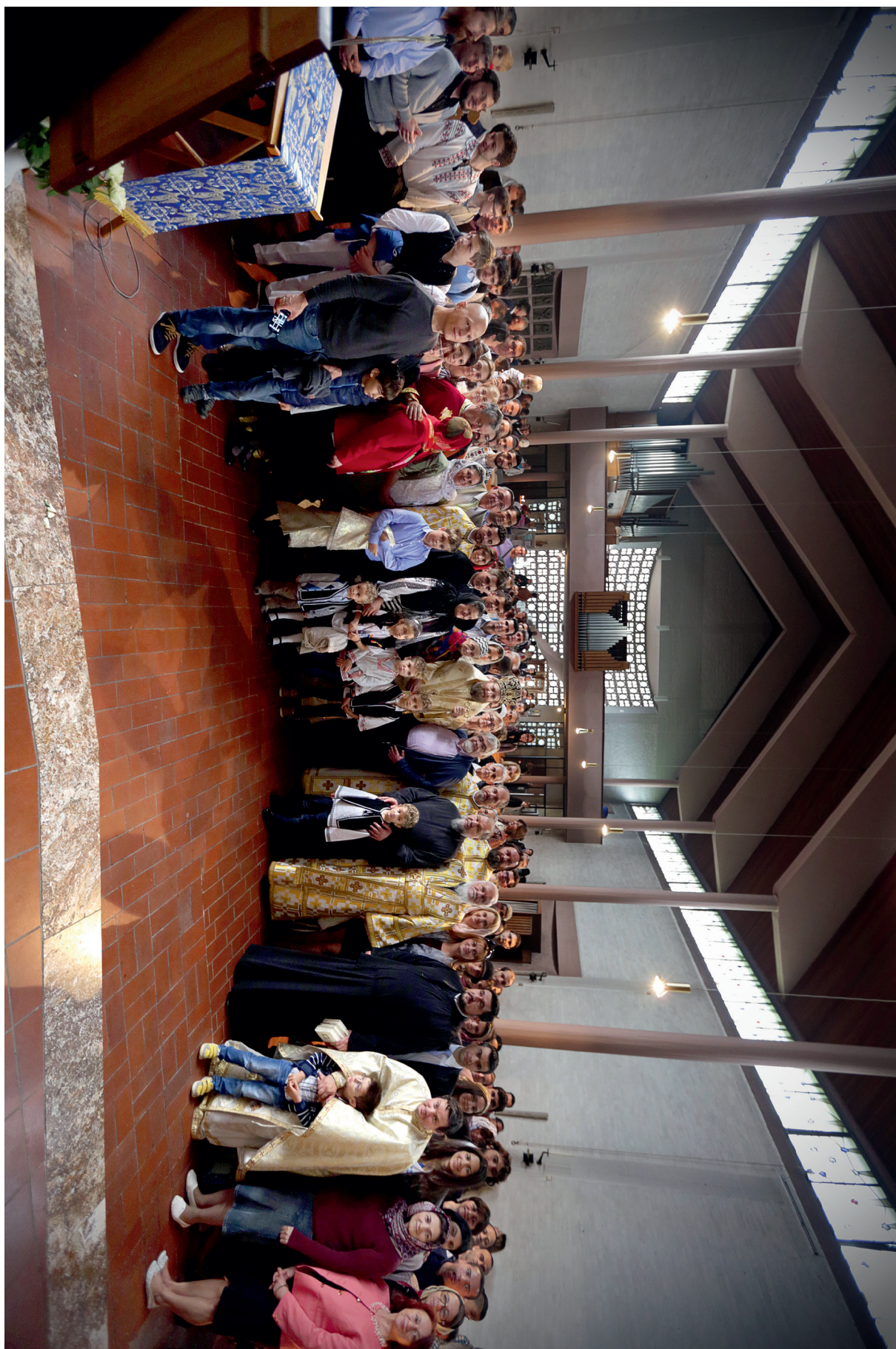
Revistă de Cultură și Spiritualitate / Zeitschrift für Kultur und Spiritualität